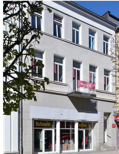
MECKLENBURGER STR. 15 19055 SCHWERIN