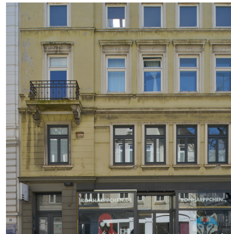
ELBCHAUSSEE 7, 22765 HAMBURG