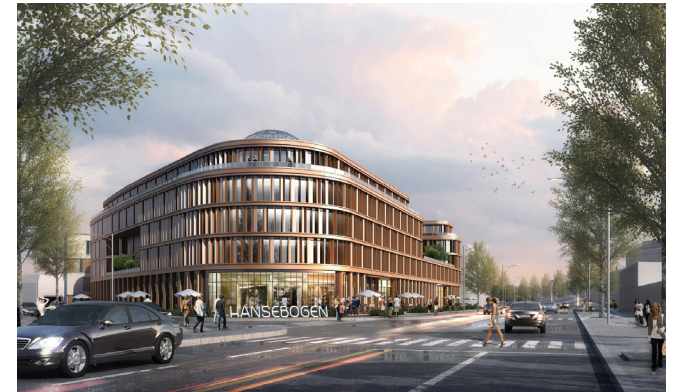
ROSTOCKER CHAUSSEE 1, 18437 STRALSUND