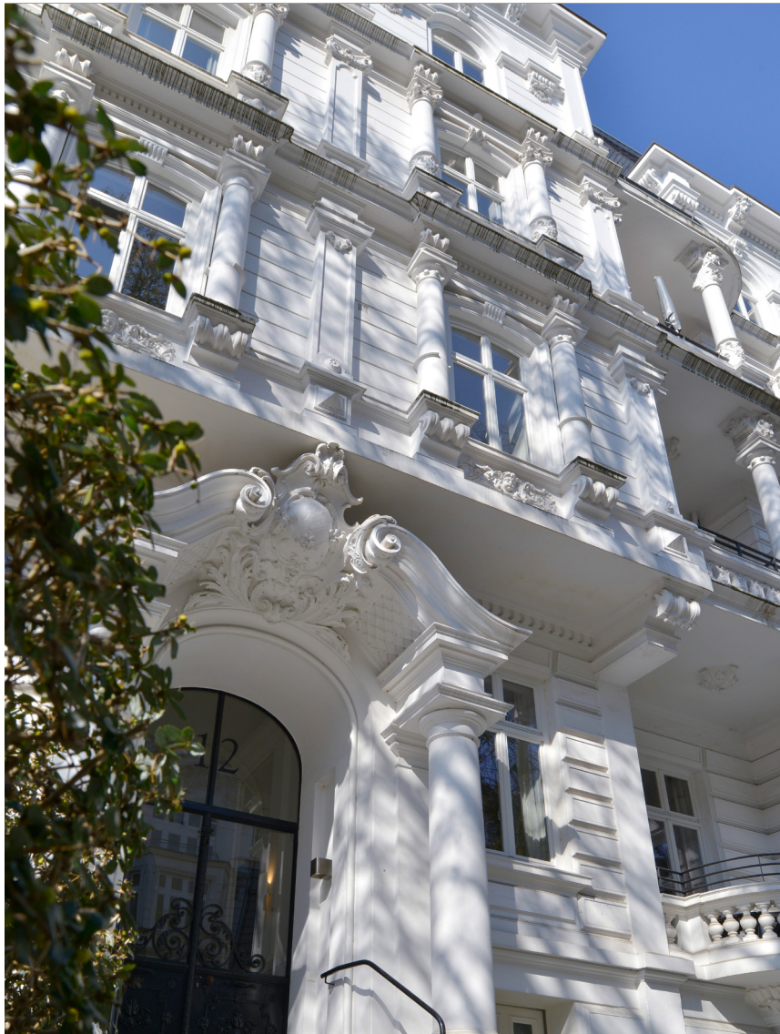
HARTUNGSTRASSE 12, 20146 HAMBURG