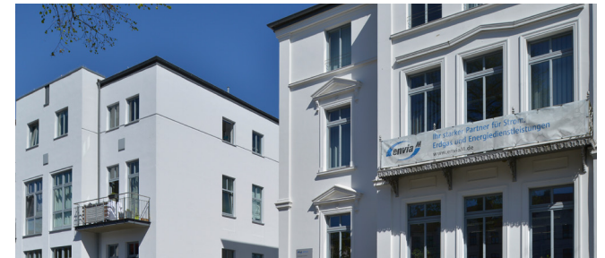
PLATZ DER JUGEND 4-6, 19053 SCHWERIN