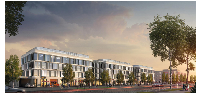
HERWEGHSTR. 50, 18055 ROSTOCK